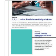
Newsletter Native ad