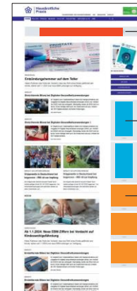
IAB Large Leaderboard*